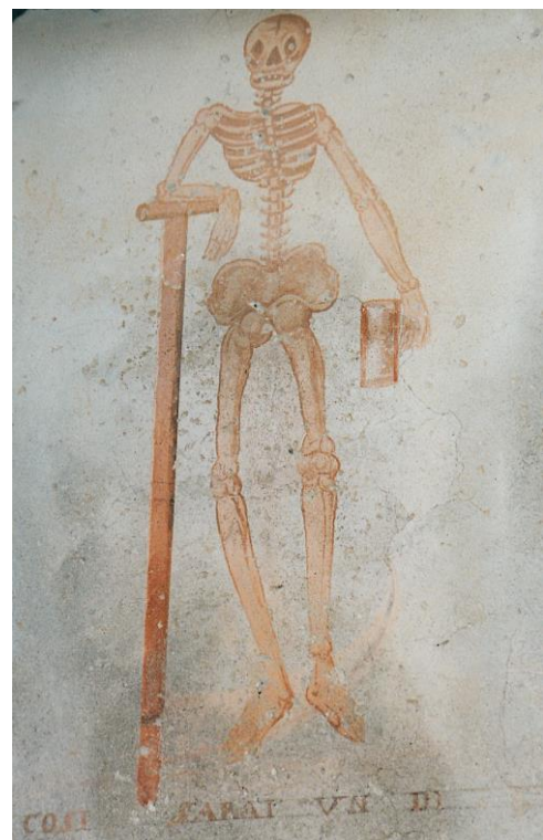
Scritta ammonitrice: "Così sarai un dì"